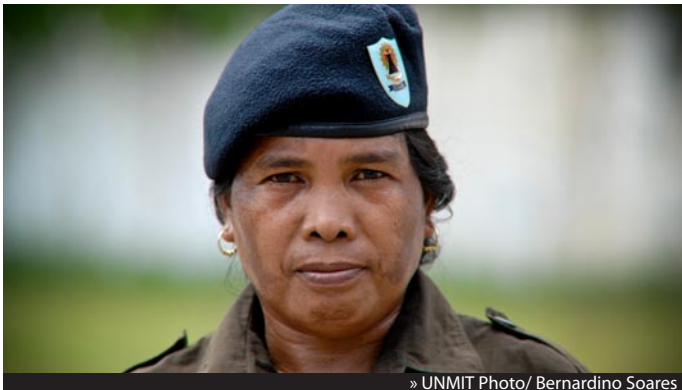
» UNMIT Photo/ Bernardino Soares

D iresaun Nasionál Seguransa ba Edifísiu Públiku nian, hanesan parte ida hosi Sekretáriu Estadu Seguransa nian. Forsa dezarmadu ne'e baibain refere ba "Seguransa Sivil" no forsa dezarmadu ne'e harii iha loron 26 fulan-Fevereiro, tinan 2000. Diretoria ne'e responsabiliza atu garante seguransa no kontrolu ba asesu edifísiu no fasilidade públiku. Nomós regula no halo monitorizasaun ba kriasaun kompañia seguransa privadu sira. Nu'udar parte ida hosi projetu Reforma Setór Seguransa ONU nian (UNMIT/UNDP), Faze treinamentu foin lalais ne'e hahú tiha ona ho kolaborasaun husi Polisia Fransa no hetan finansimentu hosi Uniaun Europeia.